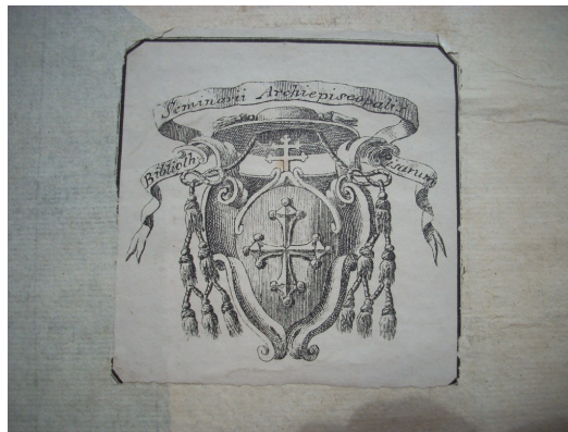
Ex libris della Biblioteca Cateriniana.