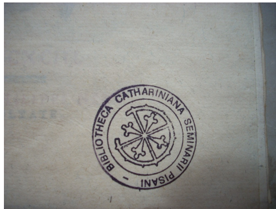
Timbro 2 della Biblioteca Cateriniana.