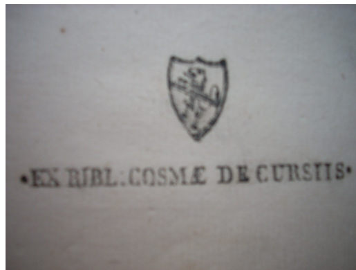
Timbro 1 del Corsi.